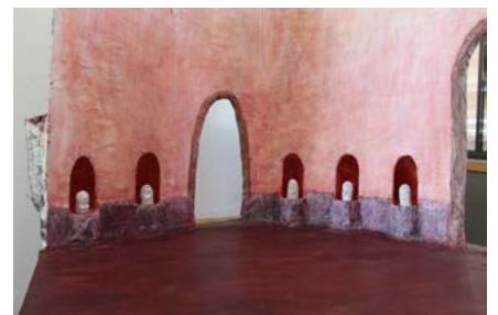
Élément de décor : La salle rose