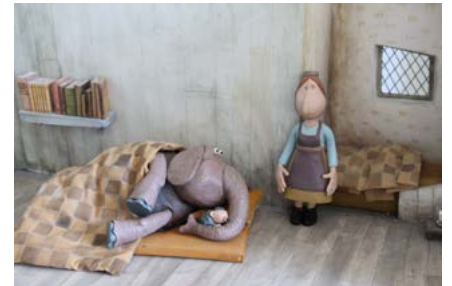
Élément de décor : la chambre de Léon