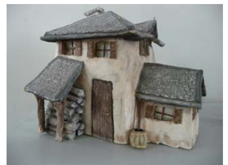
Élément de décor : La maison