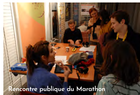
Rencontre publique du Marathon