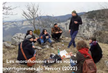
Les marathoniens sur les routes vertigineuses du Vercors (2022)

LA DÉLIBÉRATION DU COMITÉ SERA COMMUNIQUÉE AUX PARTICIPANT·ES LE 7 MARS 2023.