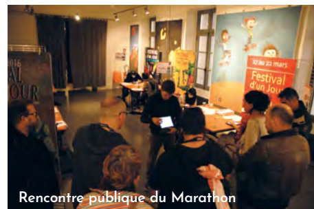
Rencontre publique du Marathon