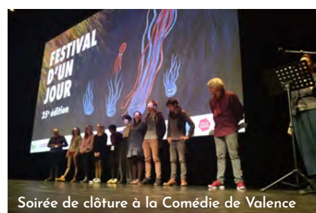
Soirée de clôture à la Comédie de Valence