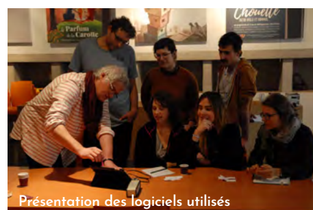
Présentation des logiciels utilisés