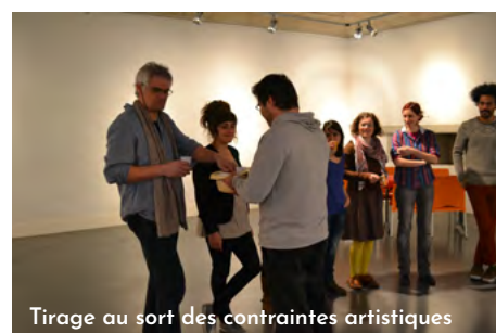
Tirage au sort des contraintes artistiques