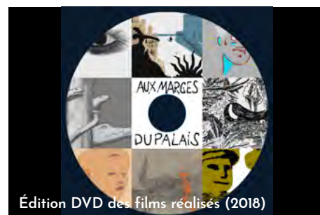
Édition DVD des films réalisés (2018)