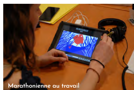
Marathonienne au travail