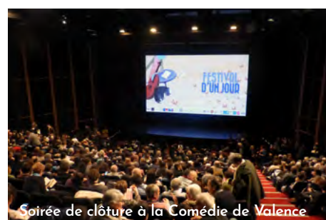
Soirée de clôture à la Comédie de Valence