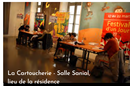
La Cartoucherie - Salle Sanial, lieu de la résidence