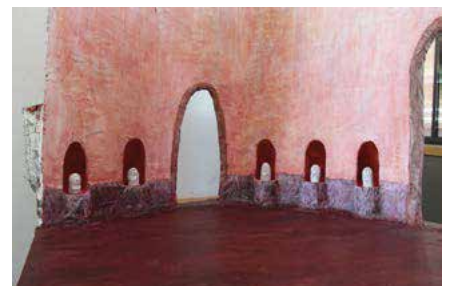
Élément de décor : La salle rose