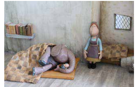
Élément de décor : la chambre de Léon