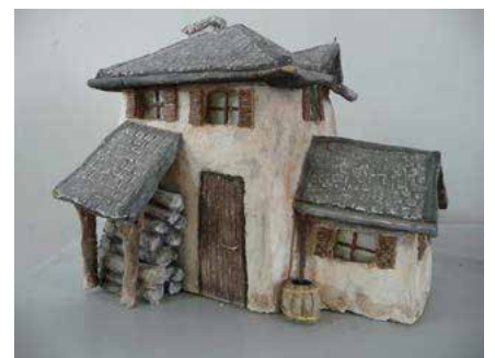
Élément de décor : La maison