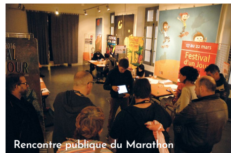
Rencontre publique du Marathon