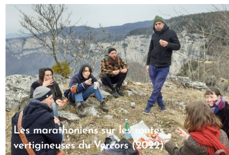
Les marathoniens sur les routes vertigineuses du Vercors (2022)

LA DÉLIBÉRATION DU COMITÉ SERA COMMUNIQUÉE AUX PARTICIPANT·ES LE 10 MARS 2025.