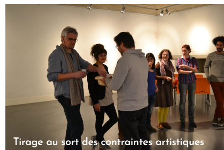
Tirage au sort des contraintes artistiques