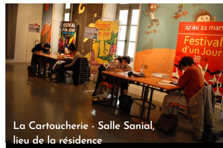
La Cartoucherie - Salle Sanial, lieu de la résidence