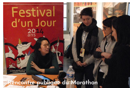
Rencontre publique du Marathon

À la fin de la résidence, les 6 séquences d'une minute seront montées avec un générique et le film sera projeté lors de la Soirée de clôture du Festival à la Comédie de Valence , le samedi 29 mars, en présence des participant-es qui partageront leurs impressions sur la performance avec le public.