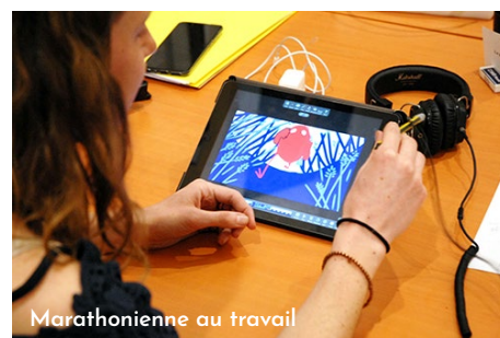
Marathonienne au travail