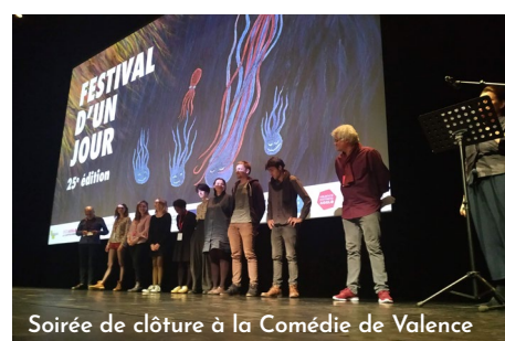
Soirée de clôture à la Comédie de Valence