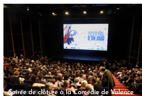
Soirée de clôture à la Comédie de Valence