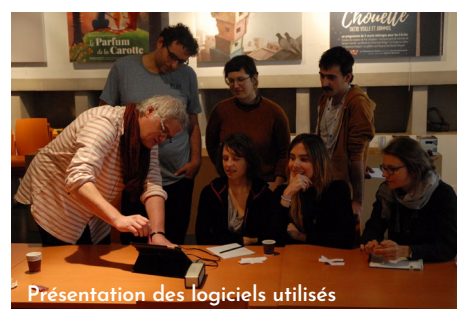
Présentation des logiciels utilisés